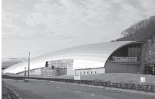
西高木 諏訪湖博物館・赤彦記念館