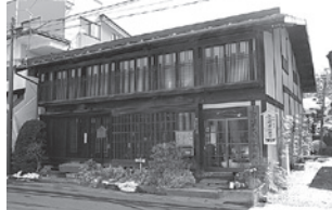
立町 歴史民俗資料館