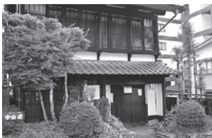
湯田町 今井邦子文学館